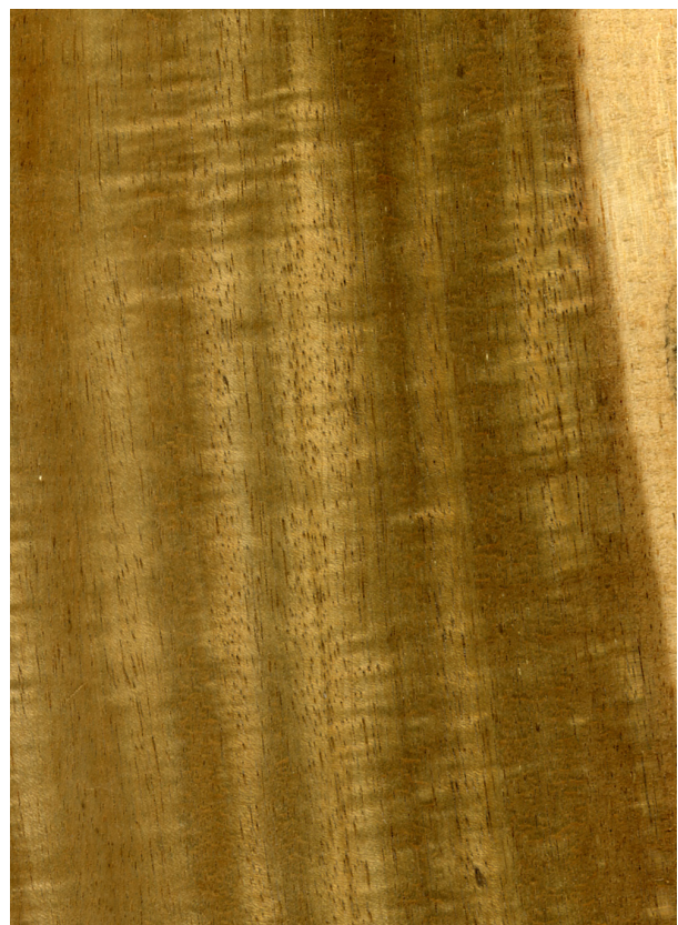
Mangium ( Acacia mangium ): Querschnitt (ca. 12-fach) und radiale Oberfläche (natürliche Größe)